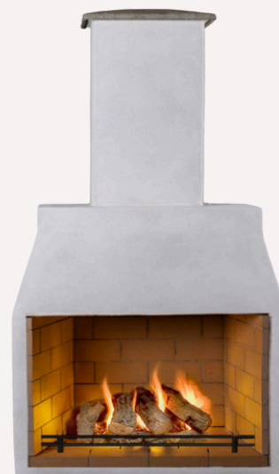
ISOKERN PREMIUM L