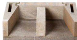
SCHOWEK NA DREWNO MODEL M KOD PRODUKTU 157837 1020 ZŁ BRUTTO