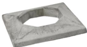
POKRYWA KOMINA MODEL S KOD PRODUKTU 130710 250 ZŁ BRUTTO