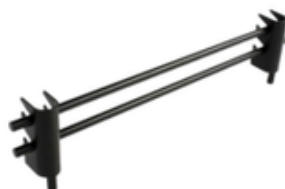
UCHWYT NA KŁODY DO MODELU S KOD PRODUKTU 135245 260 ZŁ BRUTTO