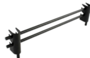
UCHWYT NA KŁODY DO MODELU M KOD PRODUKTU 151922 310 ZŁ BRUTTO