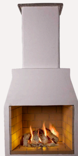
ISOKERN STANDARD M