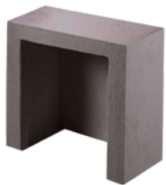
BOCZNY SCHOWEK NA DREWNO MODEL PREMIUM S KOD PRODUKTU 157838 790 ZŁ BRUTTO