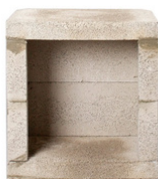
BOCZNY SCHOWEK NA DREWNO MODEL S KOD PRODUKTU 168901 1070 ZŁ BRUTTO