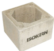
PUSTAK KOMINOWY MODEL M+L KOD PRODUKTU 130708 120 ZŁ BRUTTO