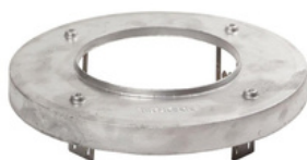
PIERŚCIEŃ DO CZAPY MODEL S KOD PRODUKTU 130675 520 ZŁ BRUTTO