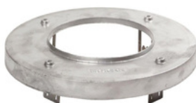
PIERŚCIEŃ DO CZAPY DO MODELU M / L KOD PRODUKTU 135093 590 ZŁ BRUTTO