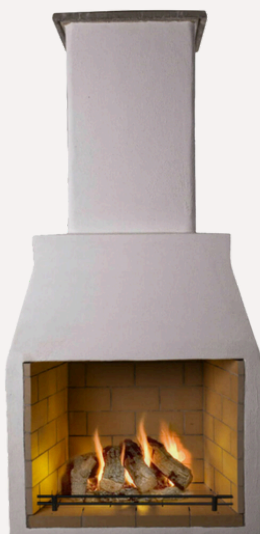
ISOKERN PREMIUM M