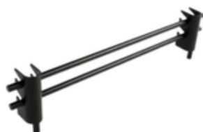
UCHWYT NA KŁODY DO MODELU L KOD PRODUKTU 151924 370 ZŁ BRUTTO