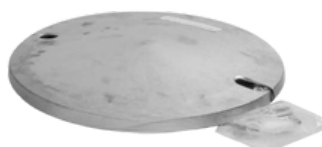
CZAPA KOMINA MODEL S / M / L KOD PRODUKTU 130732 490 ZŁ BRUTTO