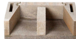
SCHOWEK NA DREWNO MODEL L KOD PRODUKTU 168902 1020 ZŁ BRUTTO