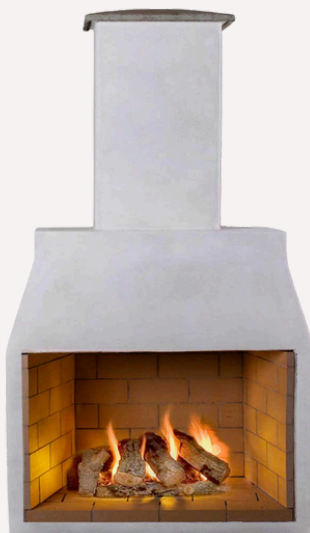
ISOKERN STANDARD L