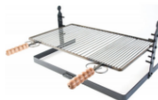
ZESTAW GRILLOWY DO MODELU M / L KOD PRODUKTU 176289 800 ZŁ BRUTTO