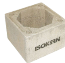
PUSTAK KOMINOWY MODEL S KOD PRODUKTU 130727 120 ZŁ BRUTTO