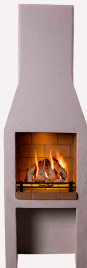
ISOKERN PREMIUM S