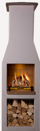
ISOKERN STANDARD S